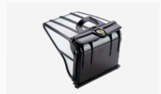
Großer Filterkorb (5L)

Leicht herausnehmbar und einfach zu reinigen